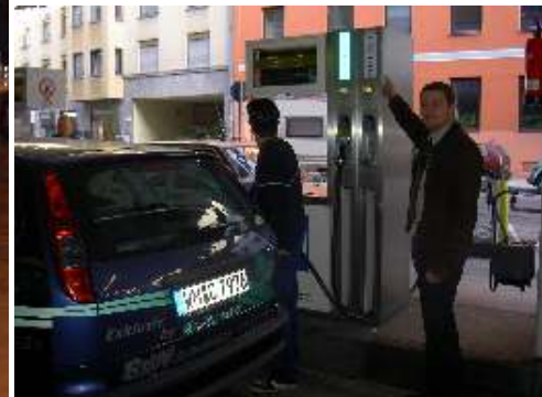
E85-Zapfsäule in München

27. Feb Bayerisches Fernsehen dreht für die Sendung „Unkraut“ einen Bericht über „Alkohol im Tank“, Mobil ohne Fossil stellt den Ford Flexi-Fuel vor