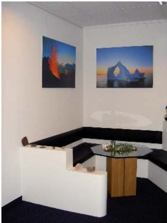
Konferenzraum - Ecke

Bilder und Preise können auf der Internetseite www.glodis-konferenz.de abgerufen werden.