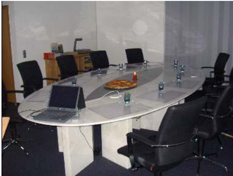
Konferenzraum - Tisch

Preise für die Mietung des Konferenzraumes: