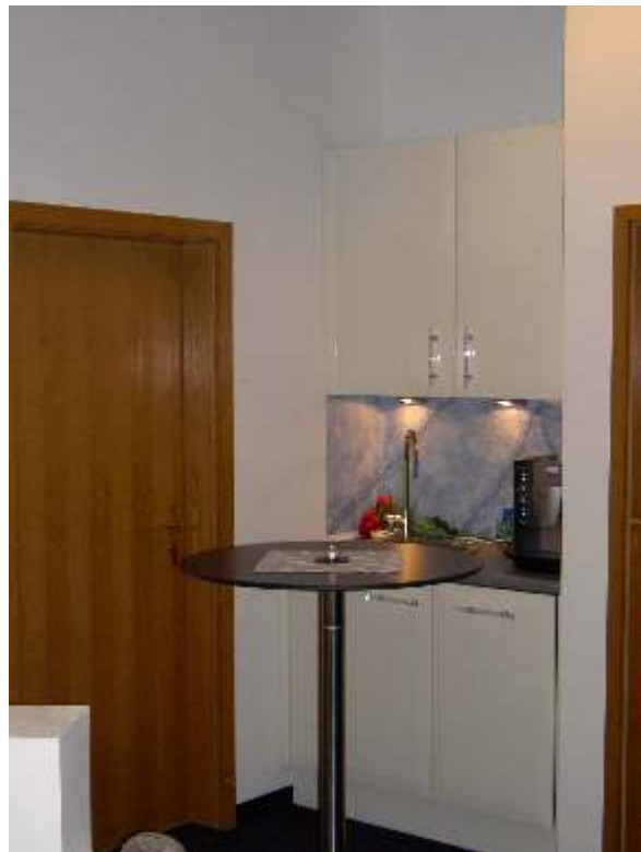
Konferenzraum - Küche