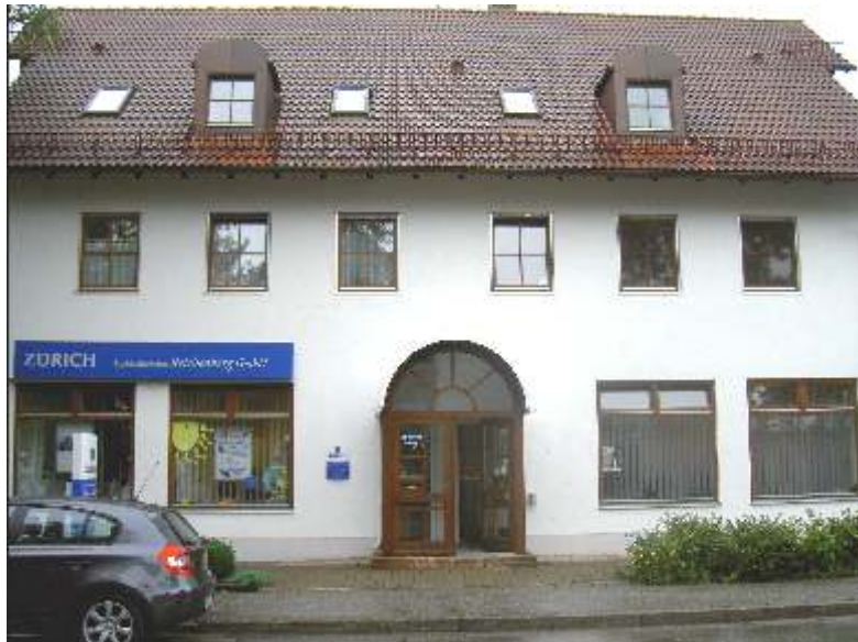
Frontansicht: links Büroräume Zürich Versicherung rechts Büroräume GloDis consultants

Das Unternehmen GloDis consultants ist eine Einzelfirma. Sie wurde am 01. November 2002 gegründet und hat ihren Firmensitz in der Kaltenmoserstraße 10 in 82362 Weilheim (i. OB.).